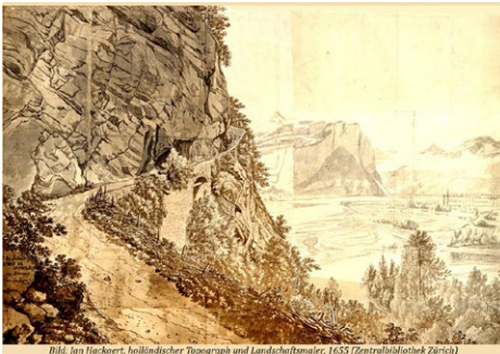
Bild: Jan Hackaert, holländischer Topograph und Landschaftsmaler, 1655 (Zentralbibliothek Zürich)

Eine besondere Anfrage erreichte mich im Juni: Eine Studentin aus den USA bat um ein aktuelles Foto der alten Schollbergstrasse . Für einen wissenschaftlichen Bericht wollte sie die heutige Ansicht mit einer Darstellung aus dem Jahr 1655 des Topografen Jan Hackaert vergleichen.